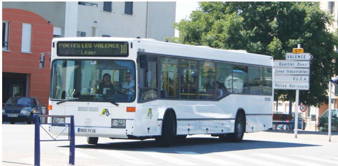
Le bus numéro 10 arrive à l'arrêt "Mairie de Portes-lès-Valence"

Concrètement qu'est-ce qui va changer pour les Portoïis ?