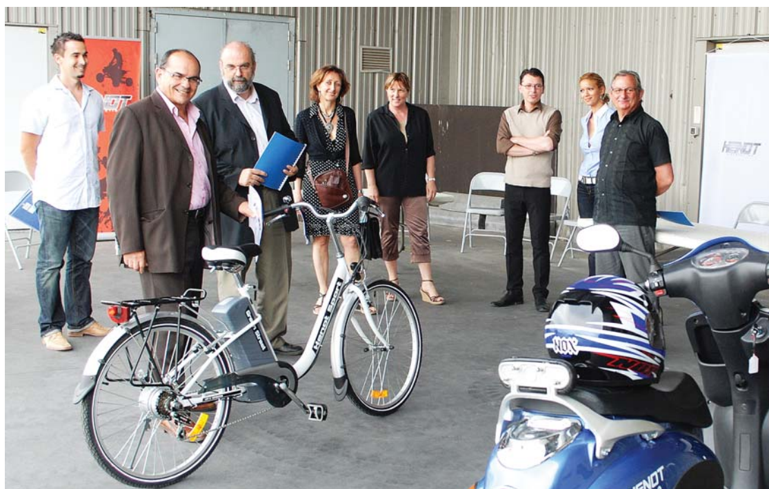
Devant le scooter électrique et le vélo à assistance électrique

S'inscrivant dans la logique du Grenelle de l'environnement, l'entreprise portoise entend investir davantage sur les produits