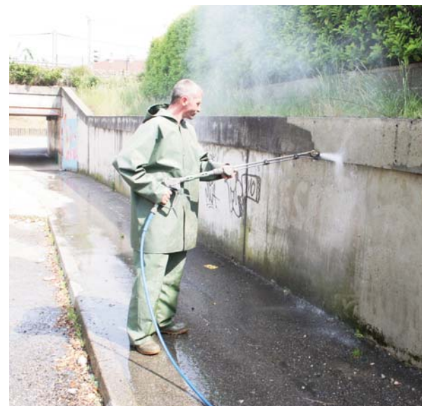
Nettoyage au karcher des graffitis rue Anne Franck

Ainsi d'un accès handicapés sur le trottoir sud de la mairie ou de la prochaine création d'une place de stationnement sur le trottoir de la laverie automatique... Ce qu'on verra