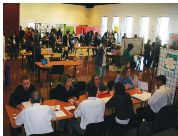
Entretiens en direct