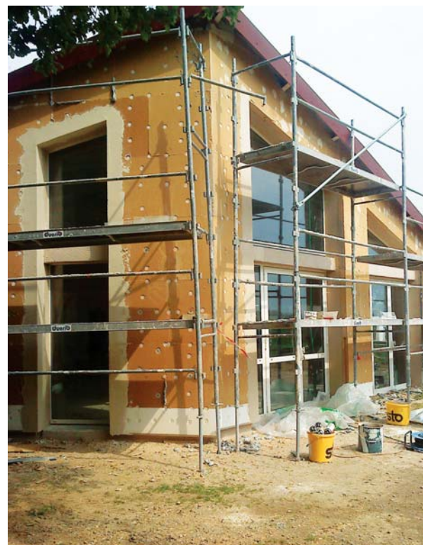
Installation de matériaux en fibre de bois

Au chapitre de la voirie, il faut également