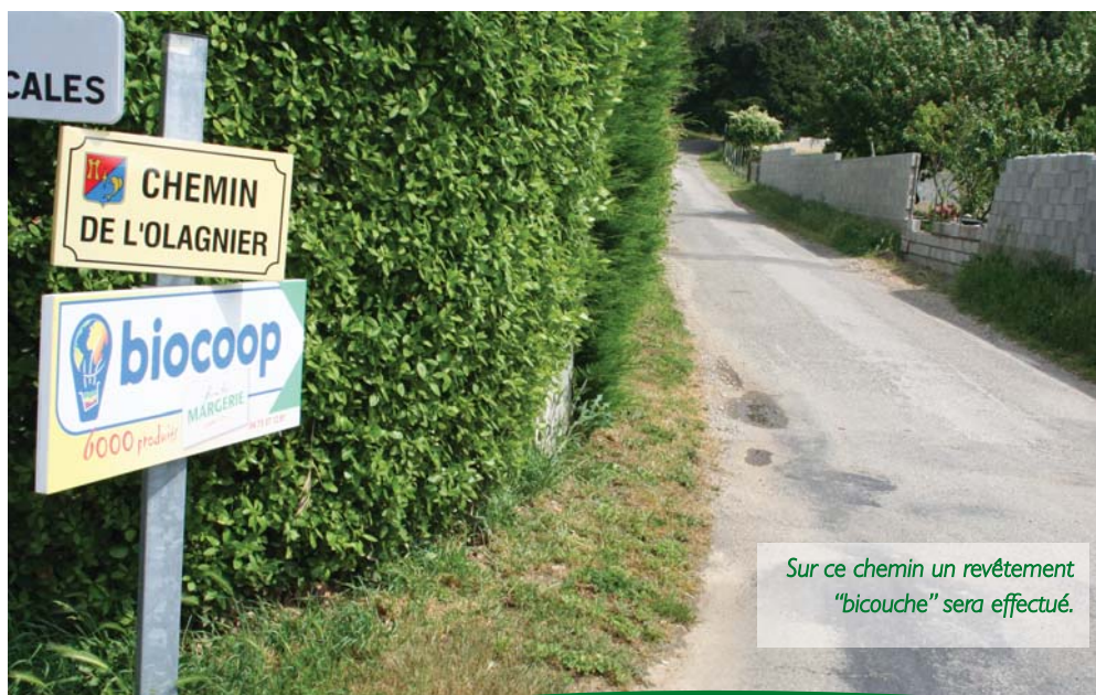
Sur ce chemin un revêtement "bicoche" sera effectué.

Rues Delaune-Aragon, Casanova, Thorez, Voltaire, Éluard, Ampère, du 19 mars, Jules Guesde, Mermoz, Moloïse, Rostand, Rousseau, Diderot, Barbusse, Descartes, Ferry, Péri, Descartes, Joliot-Curie, Pasteur et Paul Vaillant Couturier, Chemins de l'Olagner, de la Gare et des Îles, Avenue de l'Europe, Giratoire Jean Macé (route de Monerit), ZAC 3, Deux voies SNCF, Espace Cristal, Bois de la Chaffine, Centre loisirs, Places de la rue Jacques Brel et de la Libération, Centre commercial.