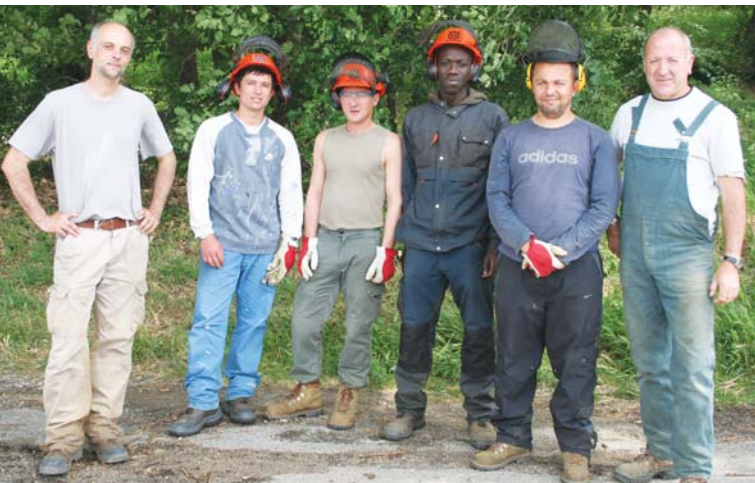
Une partie de l'équipe avec les deux techniciens d'encadrement

Ce poumon vert de la commune a fait l'objet de chantiers d'insertion.