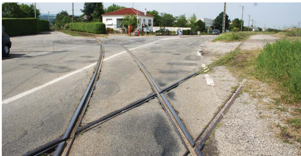
De l'enrobé sera posé autour des voies rue Jules Guesde.