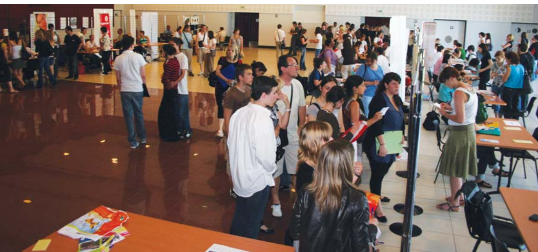
287 jeunes ont répondu à l'initiation de ce premier forum